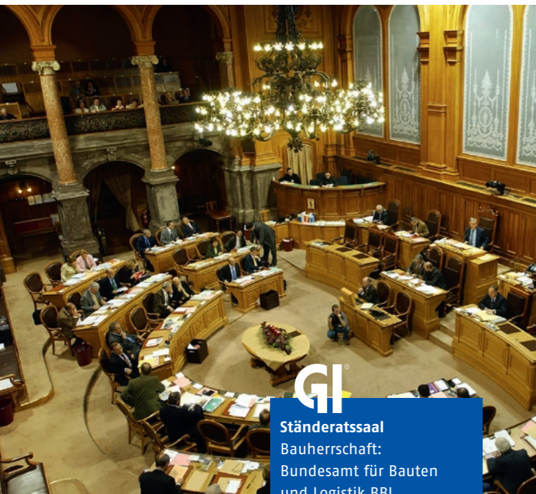
GI Ständeratssaal Bauherrschaft: Bundesamt für Bauten und Logistik BBL Zertifikats-Nr. 094-GI-2221