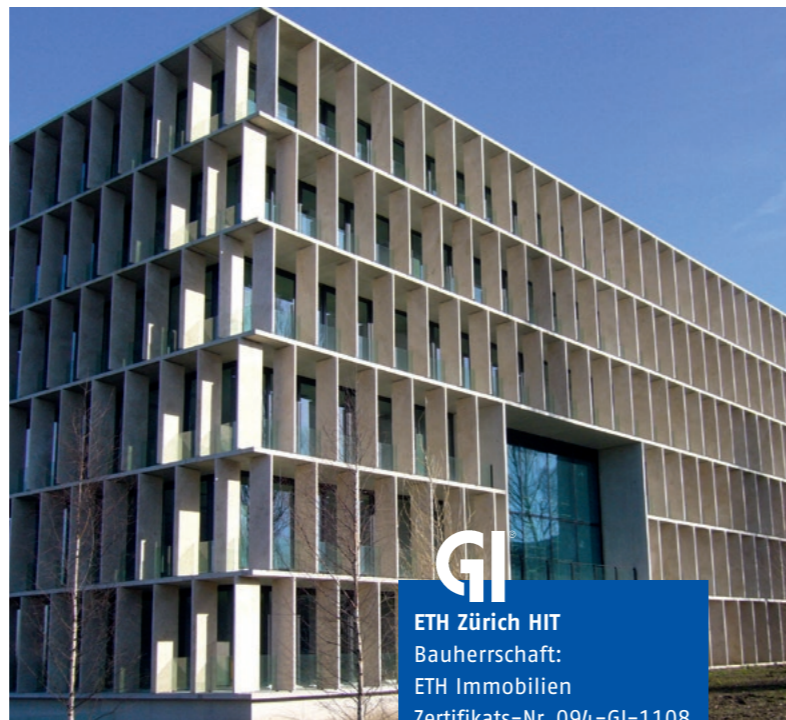
GI ETH Zürich HIT Bauherrschaft: ETH Immobilien Zertifikats-Nr. 094-GI-1108