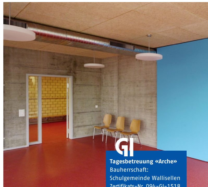
GI Tagesbetreuung «Arche» Bauherrschaft: Schulgemeinde Wallisellen Zertifikats-Nr. 094-GI-1518