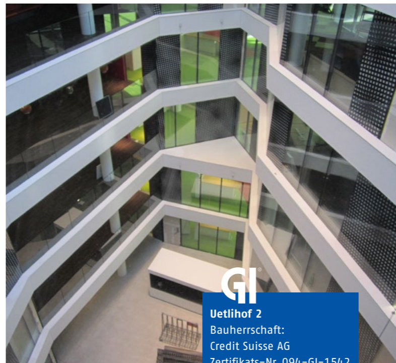
GI Uetlihof 2 Bauherrschaft: Credit Suisse AG Zertifikats-Nr. 094-GI-1542